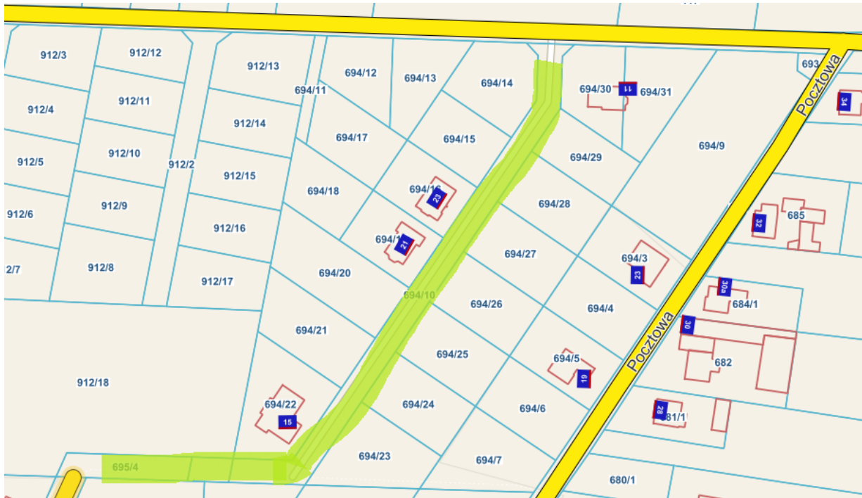
Przedłużenie ul. Spokojnej