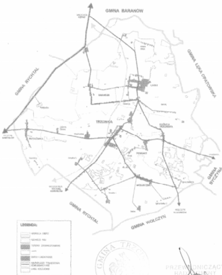
Mapa Gminy Trzcinica